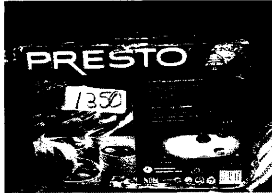
Olla exprés marca PRESTO 15 lt