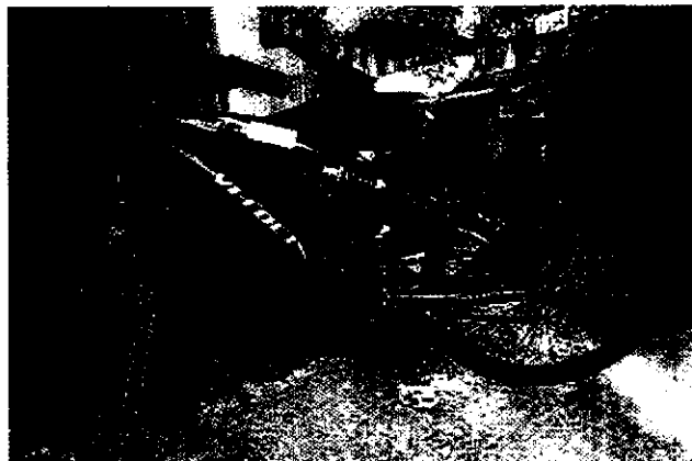
Bicicleta ARKON, rodada 26