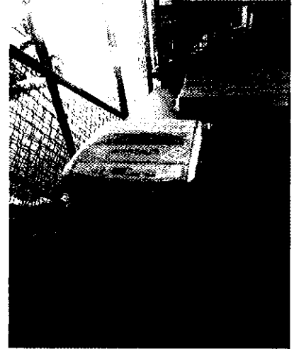
Lavadora SAMSUNG, modelo WA90U3