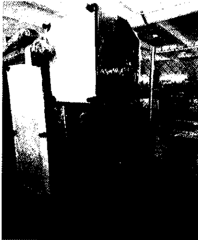
Juego de sala de tres piezas